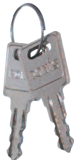
Sleutels voor afsluiten raamkruk