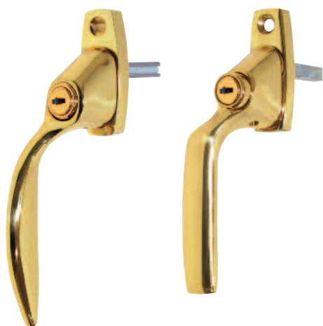
AH 803PB LH